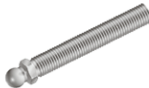
Gewindestange Stahl für Gelenkstellfüße, Kugel 15 Threaded Rod for Swivel Feet, Ball Joint 15