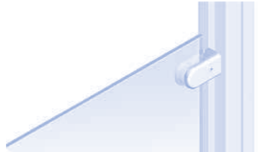
Glasscheibehalter Glass Panel Clamp