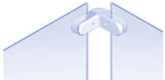
Eckverbinder für Glasscheibenhalter Corner Connection for Glass Panel Clamp