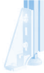
Bodenwinkel 45 Floor Bracket 45